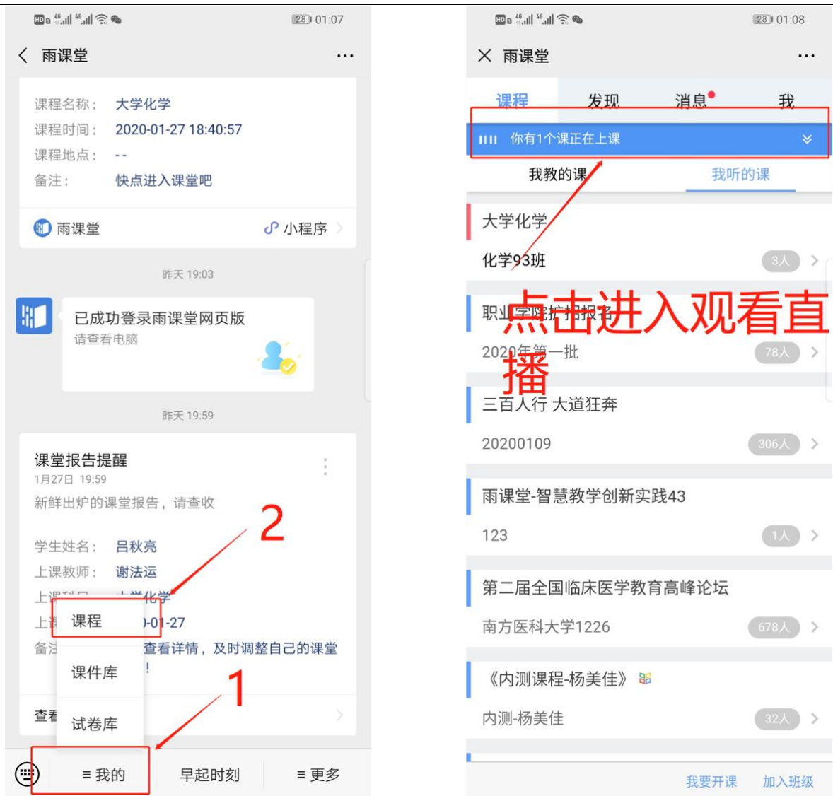
图 6 公众号进入直播