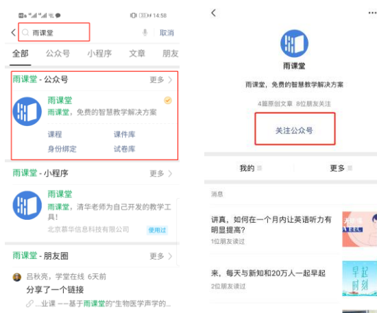
图 1 关注“雨课堂”