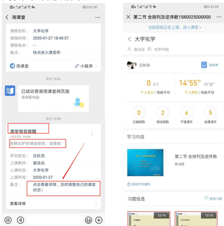
图 14 课堂报告

每次直播结束后每位同学都会收到雨课堂自动推送给大家的学习报告。错误习题、不懂课件、收藏课件、课程 PPT，雨课堂都帮各位同学整理好，关注每一节课的动态，助力你的改变和成长，如图 14 所示。