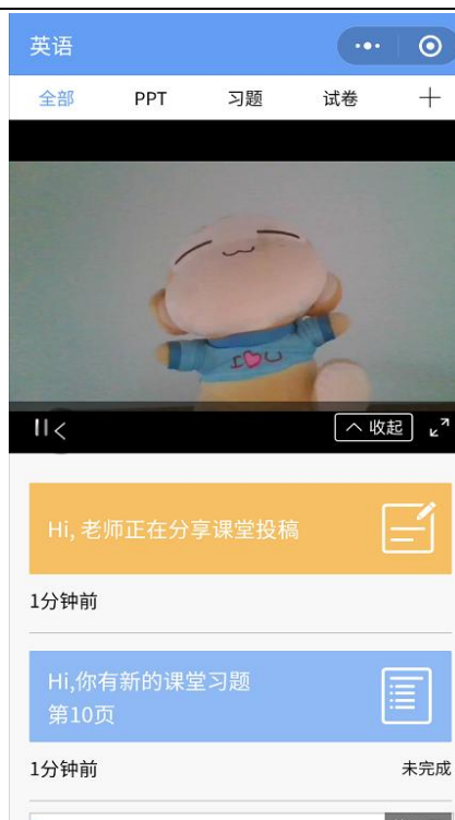
图 9 学生手机端直播预览效果