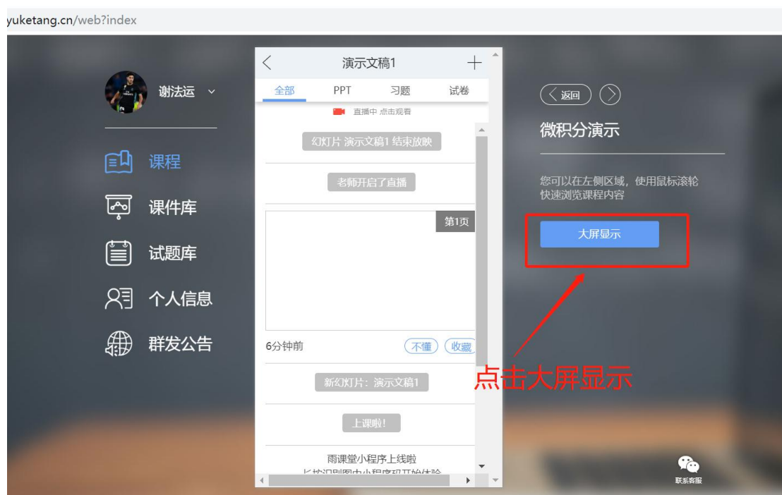
图 9 可进入大屏显示