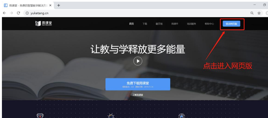
图 7 雨课堂网页版登录界面

通过浏览器进入雨课堂网页版 ( http://yuketang.cn ), 点击右上角【登录网页版】, 如图 7 所示。之后用绑定了账号的微信扫码进入课程观看页面。