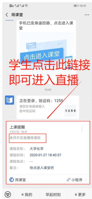
图 3 学生接收上课直播提醒