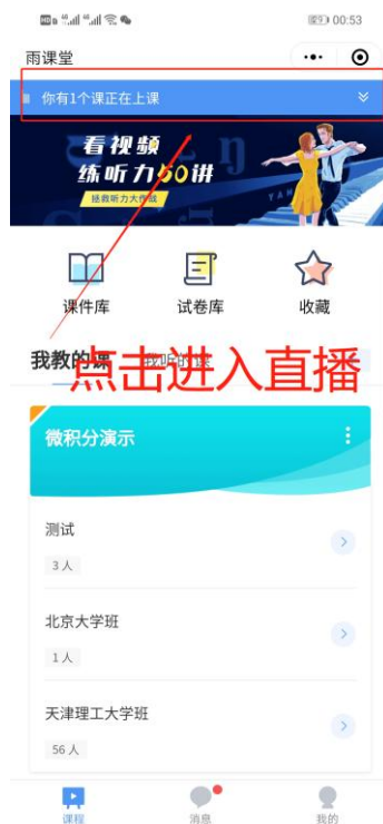
图 5 小程序进入直播界面