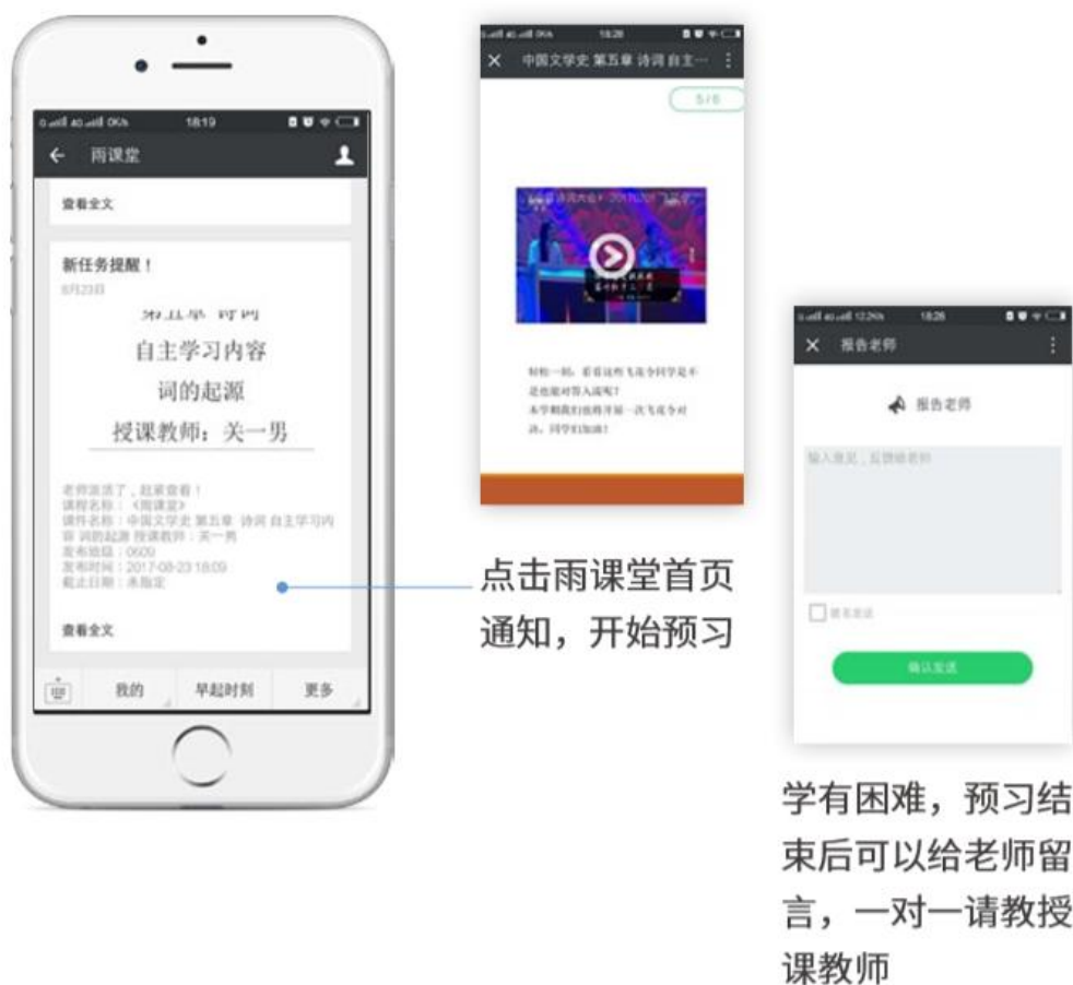
图 15 接收预习任务并完成预习

若老师给学生推送了预习资料，各位同学将在雨课堂公众号里收到相应的通知提醒，点击该提醒即可启动预习，预习之后带着思考去上课。（ 温馨提示：请在老师规定时间内完成预习。老师能看到你什么时候完成预习，预习了哪几页等信息 ）