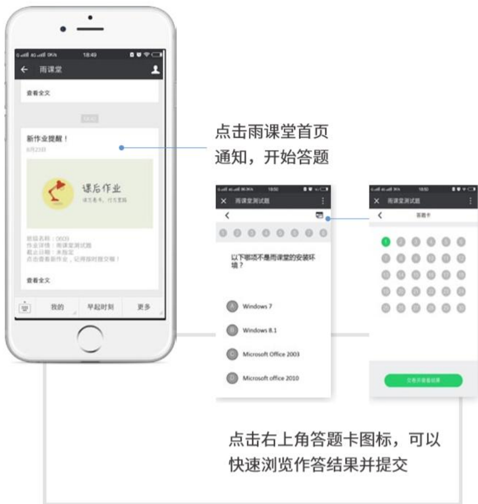
图 16 作业提醒