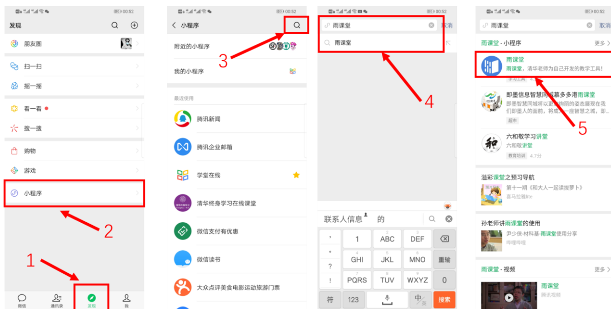
图 4 搜索进入雨课堂小程序

进入雨课堂小程序后，在小程序上方若发现有“你有 1 个课正在上课”的提示，点击该提示即可进入直播。如图 5 所示。